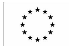
Version noir et blanc

2/ Faire mention au soutien du Fonds social européen en complément des logos de signature.