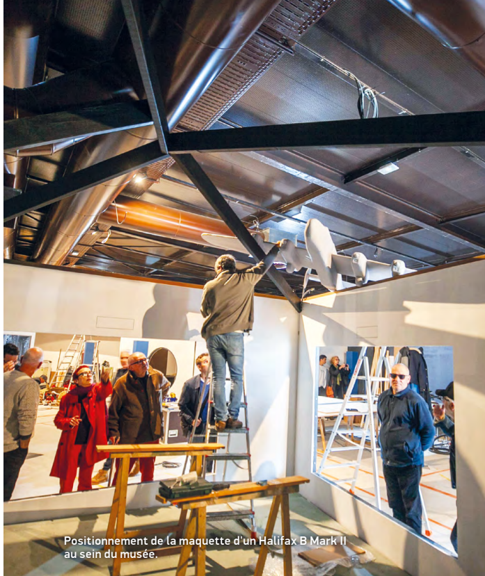
Positionnement de la maquette d'un Halifax B Mark II au sein du musée.