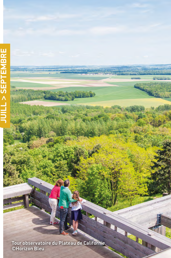
Tour observatoire du Plateau de Californie.