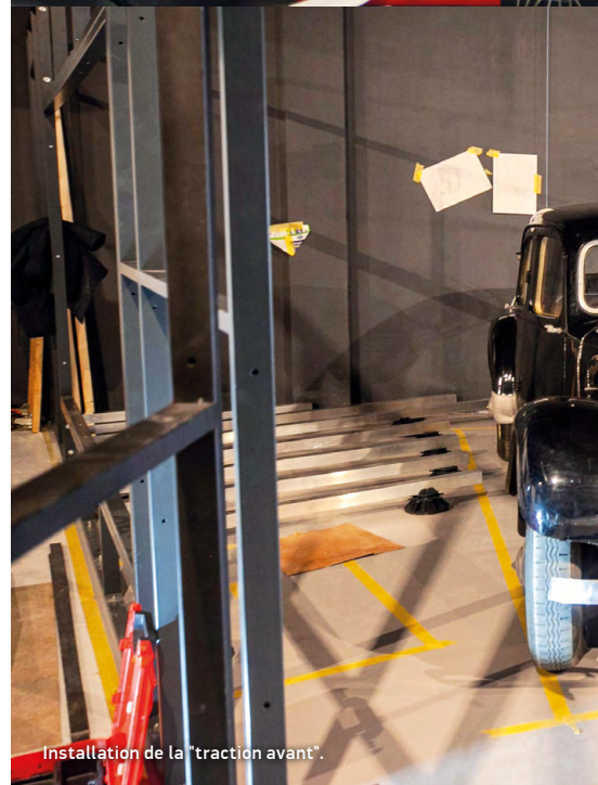
Installation de la "traction avant".