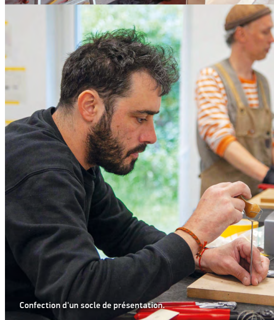
Confection d'un socle de présentation.