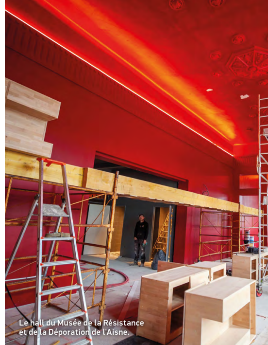
Le hall du Musée de la Résistance et de la Déportation de l'Aisne.

En attendant leur retour au sein du musée, les collections appartenant au Département sont conservées, répertoriées et préservées par le Service mémoire du Conseil départemental . Pour le musée de la Résistance et de la Déportation de l'Aisne, plus l'inventaire se poursuit, plus les collections s'agrandissent.