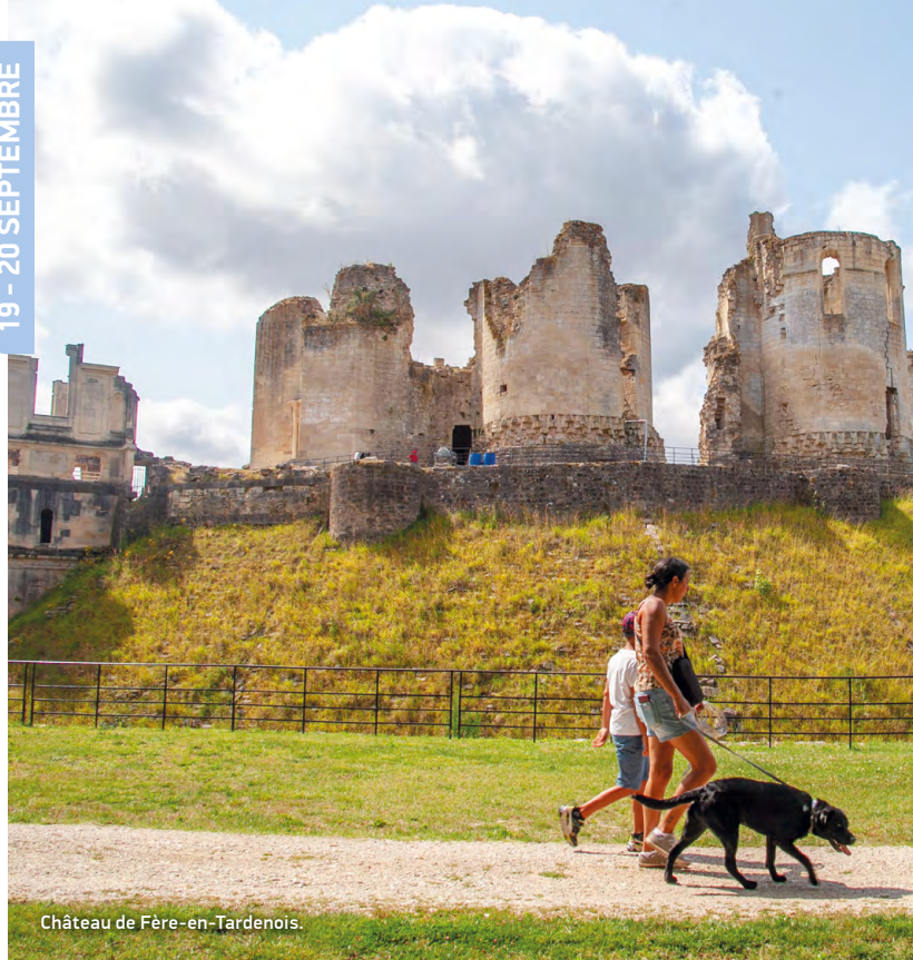
Château de Fère-en-Tardenois.