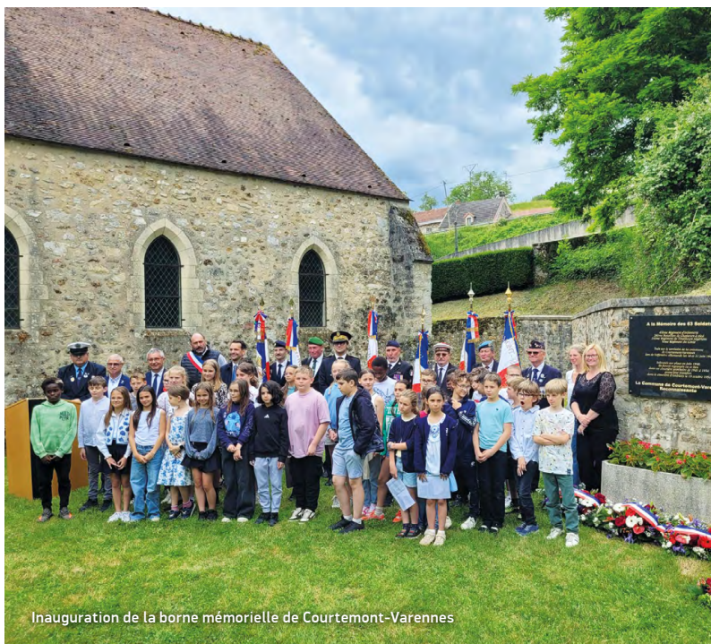
Inauguration de la borne mémorielle de Courtemont-Varennes

..... Plus d'informations sur ce chantier en scannant ce QR code ou directement sur https://www.aisne.com/actualites/saint-simon-etape-spectaculaire-pour-chantier-pont-sur-canal