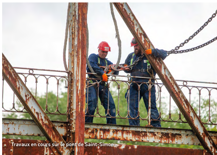
Travaux en cours sur le pont de Saint-Simon

SUIVEZ TOUTE L'ACTUALITÉ DE VOTRE DÉPARTEMENT