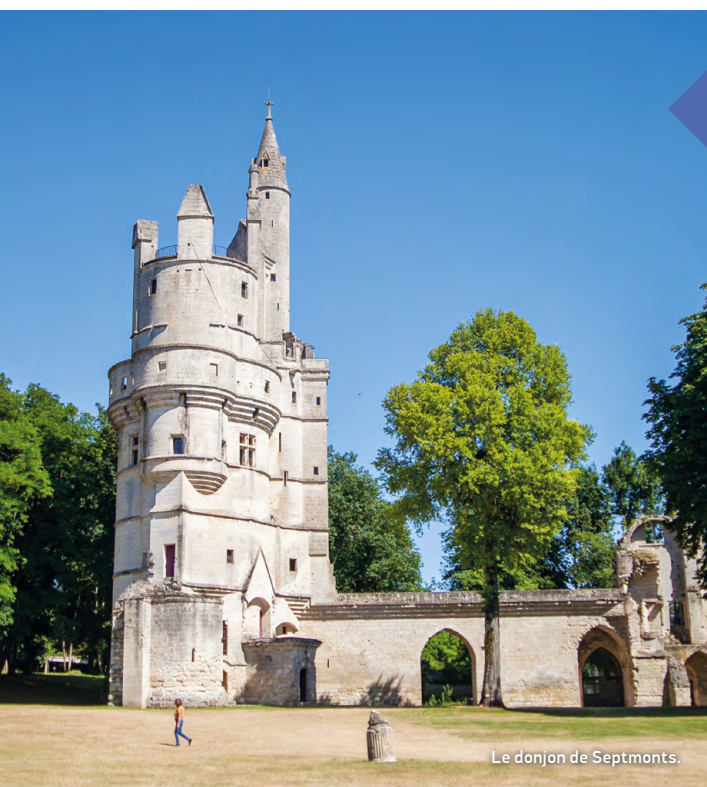
Le donjon de Septmonts.