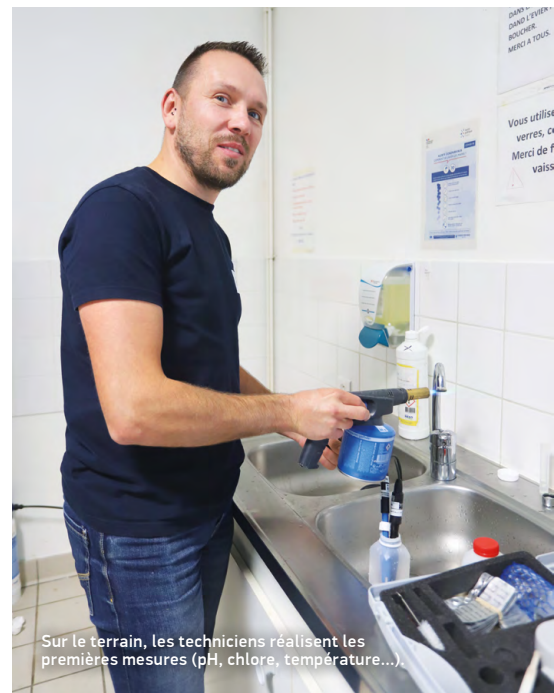
Sur le terrain, les techniciens réalisent les premières mesures (pH, chlore, température...).