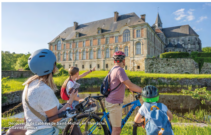
Découverte de l'abbaye de Saint-Michel, en Thiérache.