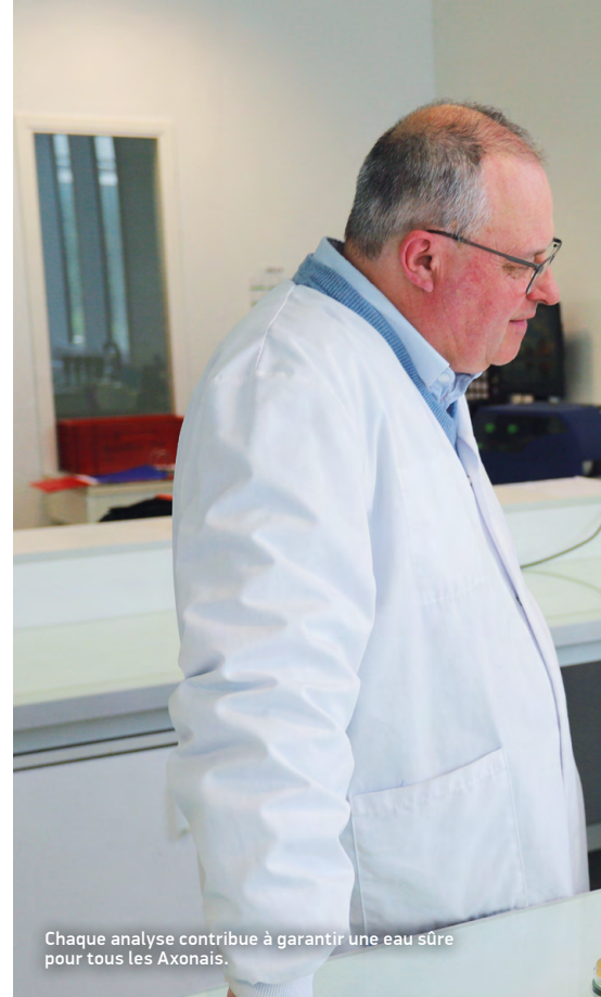
Chaque analyse contribue à garantir une eau sûre pour tous les Axonais.

Le contrôle de l'eau potable s'effectue à trois niveaux : la ressource (eaux souterraines ou superficielles), la potabilisation et le réseau de distribution jusqu'au robinet. Les préleveurs réalisent des mesures immédiates sur le terrain (pH, température, chlore, aspect, odeur) permettant de détecter toute anomalie flagrante. Les échantillons sont ensuite analysés au laboratoire pour rechercher en priorité des indicateurs de contamination fécale, comme Escherichia coli et les entérocoques intestinaux, révélateurs d'un risque sanitaire. D'autres analyses complètent ce diagnostic : flore microbienne globale, présence de sous-produits de désinfection et éléments métalliques (Plomb, Fer...).