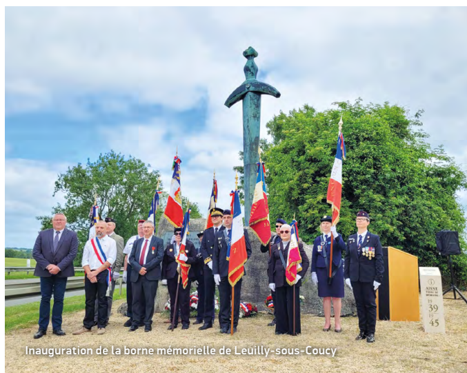
Inauguration de la borne mémorielle de Leuilly-sous-Coucy