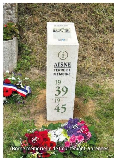
Borne mémorielle de Courtemont-Varennes