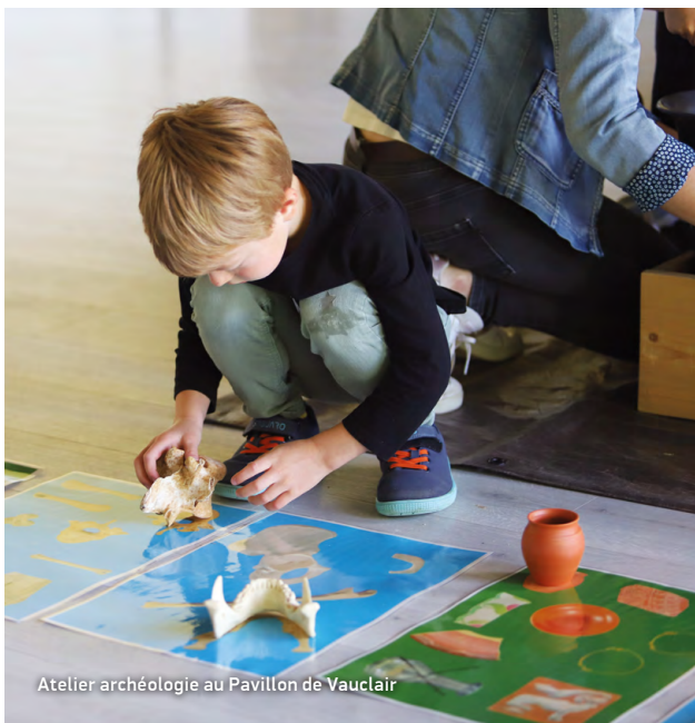
Atelier archéologie au Pavillon de Vauclair