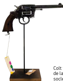
Colt tiré de l'arsenal de la Résistance sur son socle de présentation.

Pour l'ouverture, 300 pièces seront présentées , sur lesquelles les "socleurs" travaillent actuellement activement. Uniforme, arme de poing, médaille ou munition, chaque pièce se voit confectionner son socle de présentation attitré en fonction de sa nature, de son poids et de sa forme. « Notre but est souvent d'être le plus invisible possible » explique Jérôme Lepesteur, socleur pour la société Version Bronze . « Le support doit s'effacer au profit de l'objet exposé , comme pour ce Colt, tiré de l'arsenal de la Résistance qui est positionné sur son pied de façon à donner l'impression qu'il flotte dans les airs. »