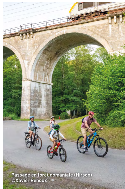
Passage en forêt domaniale (Hirson)

Découvrez les aventures de Louison Pignon en scannant ce QR code. Application téléchargeable gratuitement.